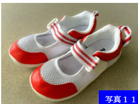
写真 1 1