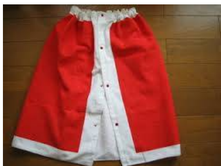
写真 1 3