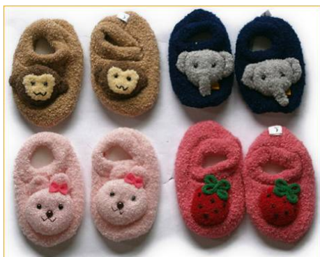
写真 1 2