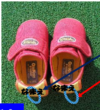
写真 1 0