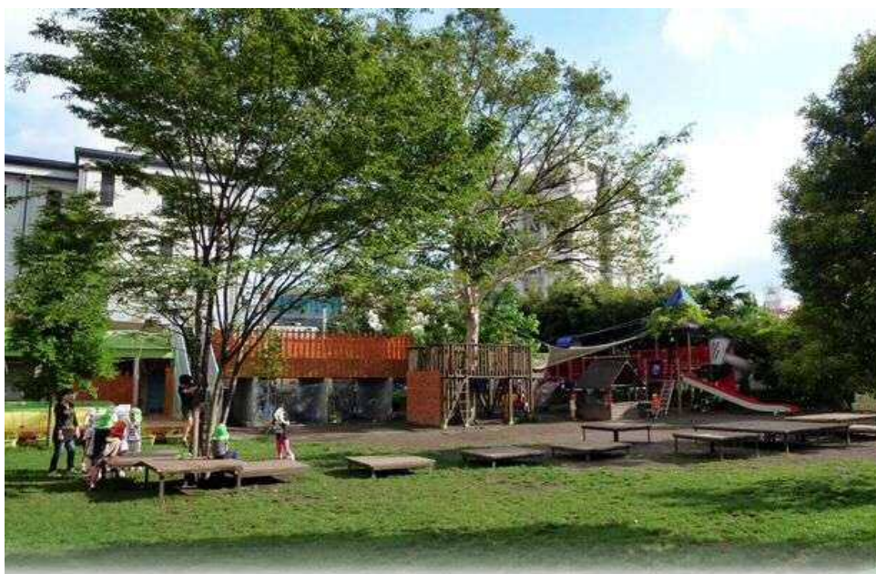
豊かな緑と水辺のある園庭