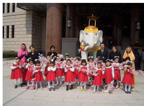
仏教行事参加(釈尊降誕会 はなまつり)