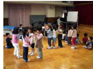
音楽クラブの様子