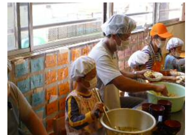
保護者保育士体験の様子