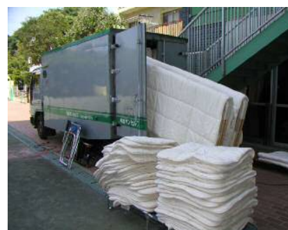
高温殺菌布団乾燥