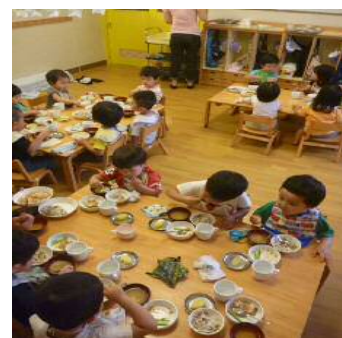
2歳クラスの給食風景