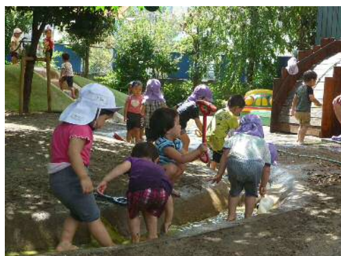
ポンプ山で水遊び(園庭)

みほとけさまは よいこをしている にこにこえがおの あかるいこ からだがしょうぶで げんきなこ ともだちとけんかをしない やさしいこ ありがとうやごめんなさいは はっきりと