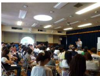
(2011.7.12 育子園ホームページ 園長ブログより)