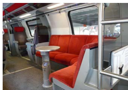
【欧州鉄道の画一的でない遊び心のある車内】