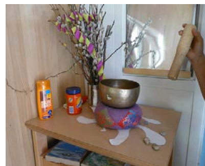
ドイツ・アムホッホシュタイン幼稚園の保育室