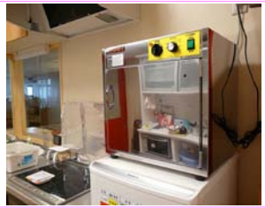
哺乳びん殺菌乾燥庫